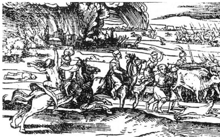
Rablást és foglyszédést megörökítő rézmetszet, 16. század

„A határvidék másik sajátos vonása a condominium , azaz a korábbi hatalmi elit és az oszmán hatóságok hosszabb-rövidebb ideig tartó közös uralma, osztozkodása a hatalmon, amely régióként és korszakokként jelentős különbségeket mutatva ugyan, de kiterjedhetett a közigazgatás, a jogszolgáltatás és az adóztatás területeire. Jóllehet az oszmánok kezdetben hallani sem akartak a magyar rendek oszmán területeken folytatott adóztatásáról és jogszolgáltatásáról, a katonai egyensúlyhelyzet és főként a magyar végvári katonaság fegyverei végül is mindkettőt kikényszerítették és mindennapos gyakorlattá tették.” (Ágoston Gábor, történész)